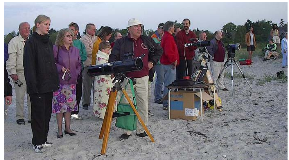
Morgenfriske medlemmer er klar til solformørkelse

Foreningen udsender et nyhedsbrev og har en e-mailingliste, der bruges til at indkalde til spontane stjerne-kiggeraftener og meddele om astronomiske nyheder. Medlemmer uden internetadgang kan få programmet tilsendt på papir.